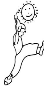
Théâtre de la Clarté